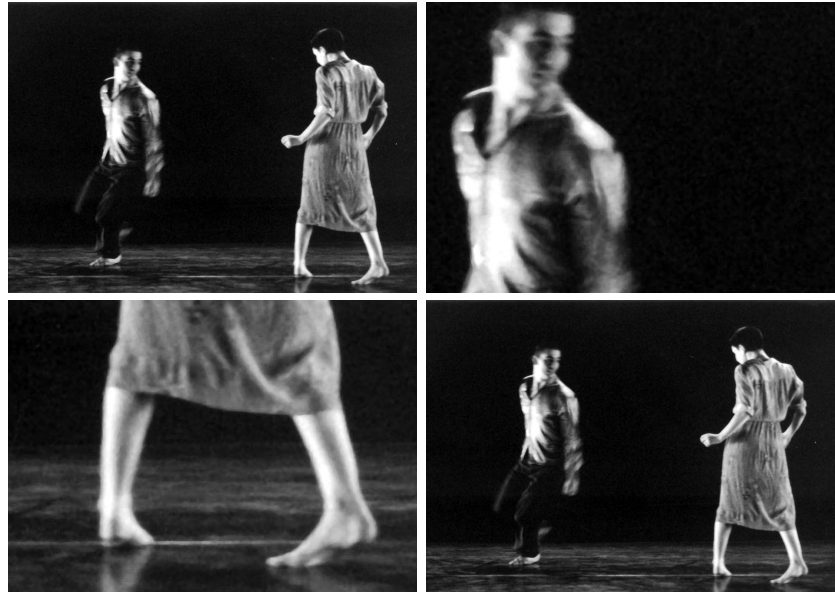
PAPOTAGES en 2000

« Le spectacle jeune public : Histoire et esthétiques », ed. La Scène